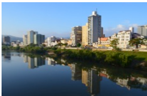
Figura 3: Rio Itajaí-Açu, centro de Blumenau

Destaca-se pela economia, na força produtiva e empreendedora da cidade. Cidade organizadora de grandes eventos e festas populares, a Oktoberfest sendo a maior delas, é sede do maior Centro de Eventos de Santa Catarina, o Parque Vila Germânica. Caracterizada pela indústria têxtil sintetizada pela Cia Hering, pelos diversos clubes de caça e tiro, pela Oktoberfest, pelos cristais, pelos belos jardins e parques naturais, pelo esporte amador, pelo turismo e pelas construções em enxaimel.