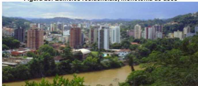
Figura 28: Edifícios residenciais, monotonia de usos

Resultante de um zoneamento modernista, a cidade foi fragmentada prevalecendo a alternatividade entre trabalho e habitação. Os demais usos não são valorizados na cidade. Como pode-se contatar pela presença de poucos equipamentos culturais: Teatro Carlos Gomes e Fundação Cultural de Blumenau, juntamente com Biblioteca Publica e alguns museus. E também somente um equipamento de lazer inserido no centro: a Prainha. Além da pequena quantidade essas atividades não são valorizadas.