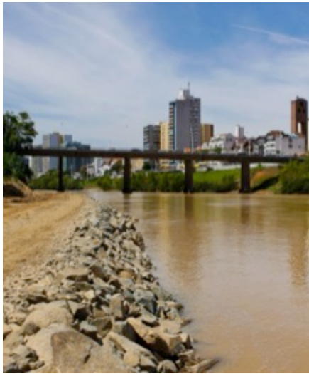
Figura 29: Obras na margem esquerda do rio