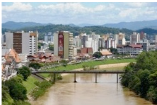
Figura 22: Margem direita do rio Itajaí-Açú

Nos últimos anos, a zona de serviços tem se expandido na direção dos bairros residenciais próximos ao centro: Ponta Aguda, Vitor Konder, Bom Retiro, Jardim Blumenau. Isto revela a natural evolução e direcionamento da área central em realmente incorporar estes distritos vizinhos configurando uma grande área central.