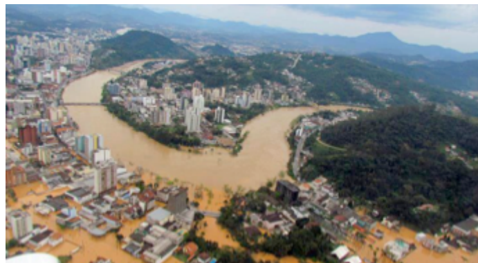
Figura 14: Enchente 2011