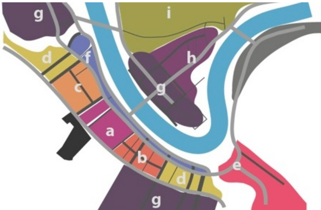
Figura 24: Unidades Morfológicas de Paisagem

(i) Morro saxônia. Morros com ocupação residencial unifamiliar, áreas de alta declividade e sem diversidade. Os acessos são isolados, falta de conexão visual valorizada. Classe social dominante c/d - segregação social.