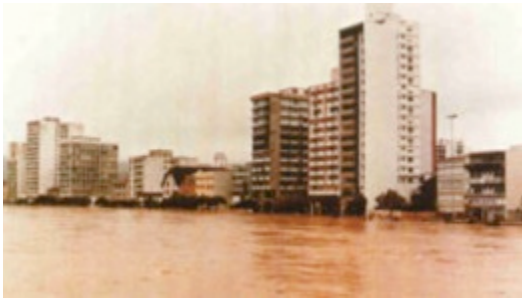
Figura 12: Enchente 1983