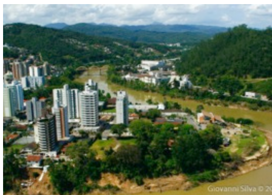
Figura 31: Rio e morros definindo a paisagem

Problemática de apropriação no morro aipim, onde há um elemento de mirante - restaurante Frohsin - atualmente fechado, pois a característica unicamente comercial privada deste ponto segrega a maior parte da população de usufruir da cidade.