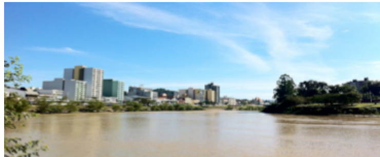
Figura 9: Av. Beira Rio atualmente