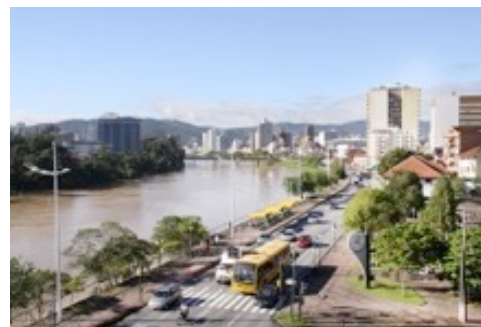
Figura 23: Av. Beira Rio