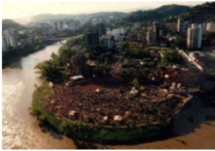
Figura 10: Show na prainha