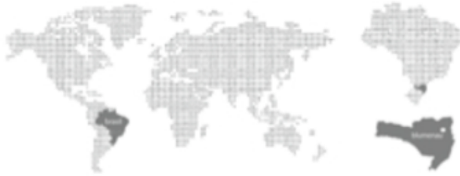
Figura 1: Localização de Blumenau

a BR470 e a SC470 nas extremidades leste e oeste, e a SC474 na extremidade norte. O rio Itajaí-Açu cruza a cidade sentido oeste-leste dividindo-a em região norte e sul.