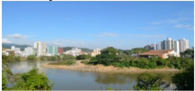
Figura 11: Av. Beira Rio atualmente