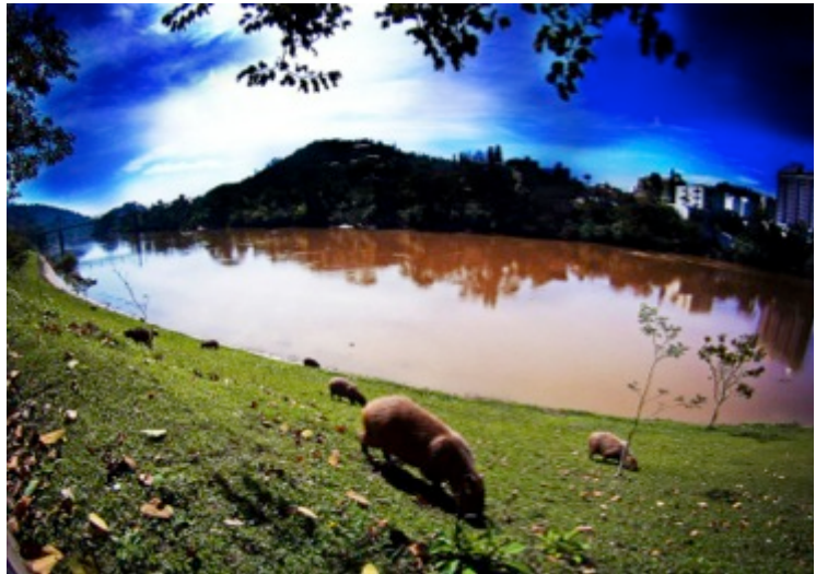
Figura 30: Fauna na margem direita do rio