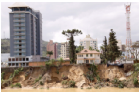
Figura 15: Devastações causadas na margem esquerda do rio Itajai-Açu