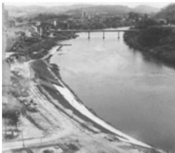
Figura 8: Construção da Av. Beira Rio