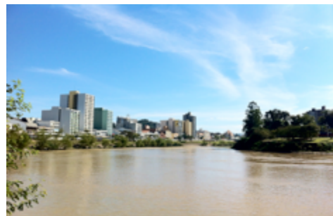
Figura 4: Rio Itajaí-Açu, centro de Blumenau