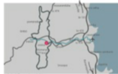
Figura 2: Vale do rio Itajaí-Açu com destaque para Blumenau e o centro da cidade