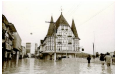
Figura 13: Enchente 1983