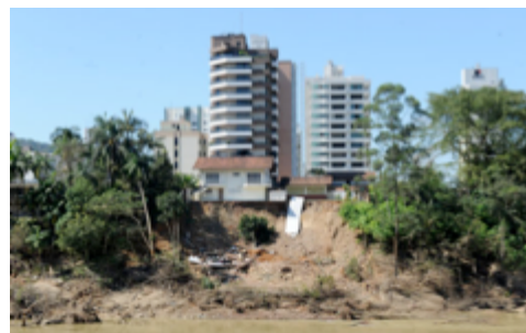
Figura 16: Devastações causadas na margem esquerda do rio Itajai-Açu