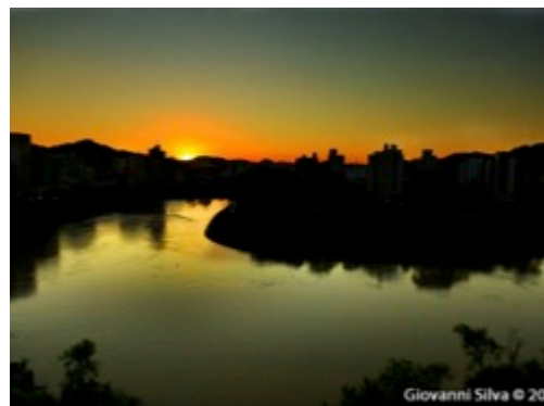
Figura 32: Rio e morros definindo a paisagem