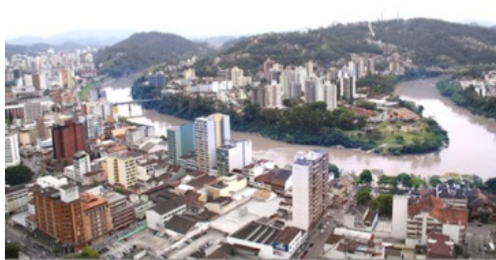
Figura 21: Rio Itajaí-Açú, centro da cidade