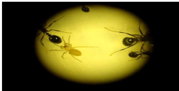
Figura 1. Attacobius sp. perseguindo e tocando as operárias de Solenopsis saevissima .

As aranhas utilizaram todos os apêndices durante o contato com as formigas, mas principalmente os primeiros pares de pernas e os pedipalpos, que constantemente eram levados às quelíceras. Erthal e Tonhasca (2001) obtiveram resultados semelhantes do comportamento de Attacobius attarum em relação às colônias de Atta sexdens mantidas em laboratório.