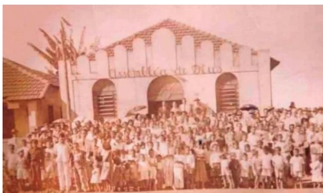
Figura 3 – Primeiro templo oficial da Assembleia de Deus na cidade de Anápolis – GO.

Entretanto, para dar-se continuidade nesta pesquisa iconográfica em andamento, aguarda-se uma liberação de fontes documentais dos familiares de um dos primeiros pioneiros deste movimento pentecostal em Goiás, dando acesso ao seu acervo particular, que apresenta uma base maior de registros fotográficos, destacando-se aqui as memórias do primeiro templo oficial da Assembleia de Deus na cidade de Anápolis – GO.