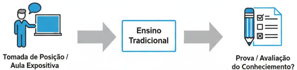
Figura 2: Ensino Tradicional

quando e como mediar o trabalho que os alunos estão desenvolvendo. (Souza, 2013, P.32).